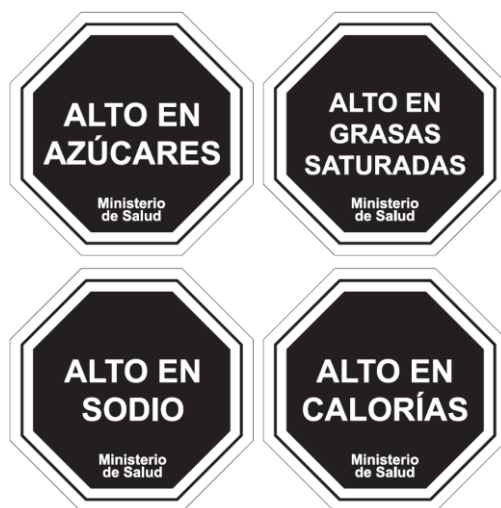
Diagrama N° 1

Las características gráficas de los descriptores nutricionales señalados en el Diagrama N°1 serán las siguientes: