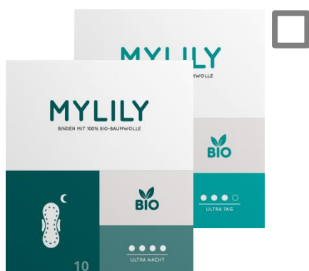
Bio-Binden (Tag & Nacht)