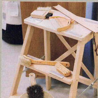
Iris Hanverk 清潔刷具

由前時尚和美容編輯、身兼兩孩媽媽創立的可持續發展澳洲清潔品牌，有別一般加入大量化學香精傳統清潔產品，品牌標誌性天然香氣——無花果天然香氣，成分全都是天然有機、濕疹及敏感皮膚人士、家中有小孩的家庭也可安心使用。