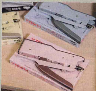
意大利 ZENITH 548/E 粉色訂書機 $350