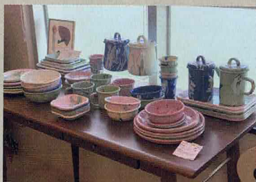
小店地方闊落光猛，更能欣賞 180 度全海景！