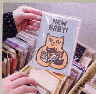
NEW BABY 賀卡 $35

得過日本文具大賞的 TRINUS 日本花色鉛筆，使用隨附的削筆器，鉛筆屑將變成美麗花瓣和菓子。