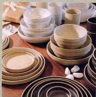
Hasami Porcelain 陶瓷餐具

來自日本製陶地區，長崎縣的波佐見町，結合日本傳統陶器工藝，手工打磨出現代化的簡約餐具。特別的堆疊設計靈感來自於傳統便當盒，每件餐具都功能十足，連托盤也可以用作為蓋子，實用美觀、方便收納，店內有齊全尺寸和類型選擇。