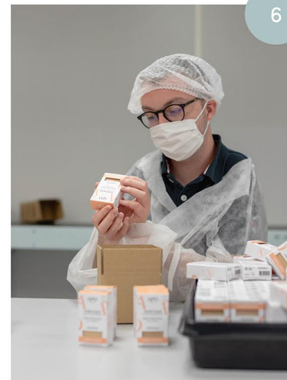
Emballage des savons à l'ESAT de Croix par des personnes en situation d'handicap