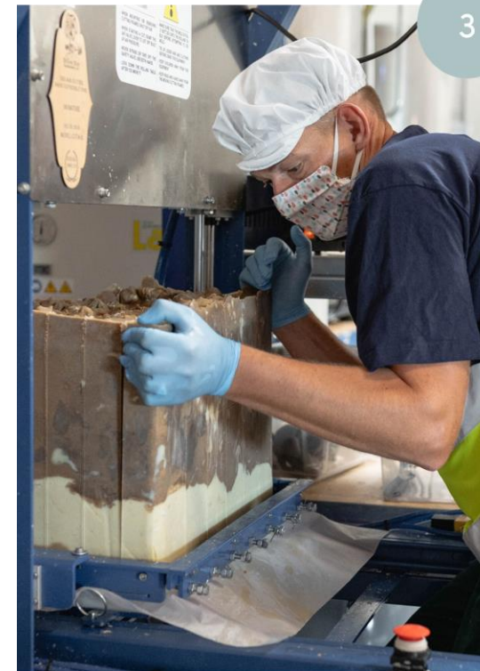
Découpe des savons en barres