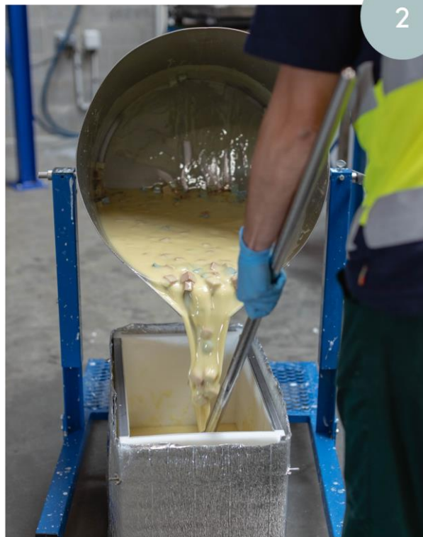
Coulage de la pâte de savon et des inclusions dans le moule