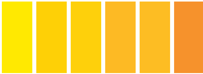
346 A S1 □ Lemon Yellow Jaune Citron Amarillo Limón 113 A S2 ■ Cadmium Yellow Light Jaune de Cadmium Clair Amarillo de Cadmio Claro 119 A S1 □ Cadmium Yellow Pale Hue Nuance de Jaune de Cadmium Pâle Tono Amarillo de Cadmio Palido 116 A S2 ■ Cadmium Yellow Medium Nuance de Jaune de Cadmium Moyen Amarillo de Cadmio Medio 109 A S1 □ Cadmium Yellow Hue Nuance de Jaune de Cadmium Tono Amarillo de Cadmio 115 A S1 □ Cadmium Yellow Deep Hue Nuance de Jaune de Cadmium Foncé Tono Amarillo de Cadmio Oscuro