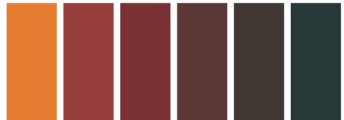
552 AA S1 □ Raw Sienna Terre de Sienna Naturelle Tierra de Siena Natural 317 AA S1 ■ Indian Red Rouge Indien Rojo Indio 074 AA S1 □ Burnt Sienna Terre de Sienna Brûlée Tierra de Siena Tostada 076 AA S1 □ Burnt Umber Terre d'ombre Brûlée Tierra de Sombra Tostada 554 AA S1 □ Raw Umber Terre d'ombre Naturelle Tierra de Sombra Natural 465 A S1 ■ Payne's Gray Gris de Payne Gris de Payne