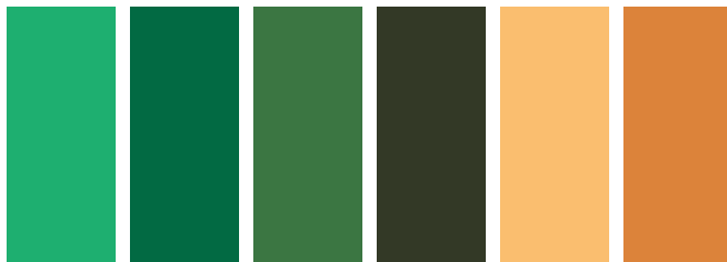
692 AA S2 □ Viridian Vert de Guignet Viridiano 522 A S1 □ Phthalo Green (Blue Shade) Vert Phthalo (Nuance Bleue) Verde Ftalo (Matiz Azul) 503 A S2 □ Permanent Sap Green Vert de Vessie Permanent Verde Vejiga Permanente 447 A S1 □ Olive Green Vert Olive Verde Oliva 422 AA S1 ■ Naples Yellow Hue Nuance de Jaune de Naples Tono de Amarillo de Napoles 744 AA S1 ■ Yellow Ochre Ocre Jaune Ocre Amarillo