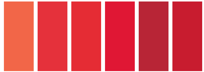
090 A S1 □ Cadmium Orange Hue Nuance de Cadmium Orange Tono de Cadmio Naranja 100 A S2 ■ Cadmium Red Light Rouge de Cadmium Clair Rojo de Cadmio Claro 099 A S2 ■ Cadmium Red Medium Rouge de Cadmium Moyen Rojo de Cadmio Medio 095 A S1 □ Cadmium Red Hue Nuance de Rouge de Cadmium Tono Rojo de Cadmio 104 A S2 ■ Cadmium Red Dark Rouge de Cadmium Foncé Tono Rojo de Cadmio Oscuro 098 A S1 □ Cadmium Red Deep Hue Nuance de Rouge de Cadmium Foncé Tono Rojo de Cadmio Oscuro