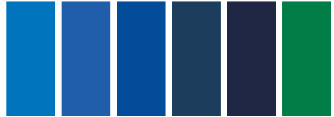
178 AA S2 □ Cobalt Blue Bleu de Cobalt Azul de Cobalto 179 A S1 ■ Cobalt Blue Hue Nuance de Bleu de Cobalt Tono de Azul de Cobalto 263 A S1 □ French Ultramarine Outremer Français Ultramar Francés 514 A S1 □ Phthalo Blue (Red Shade) Bleu de Phthalo (Nuance Rouge) Azul Ftalo (Matiz Rojo) 538 A S1 □ Prussian Blue Bleu de Prusse Azul de Prusia 521 A S1 □ Phthalo Green (Yellow Shade) Vert Phthalo (Nuance Jaune) Verde Ftalo (Matiz Amarillo)