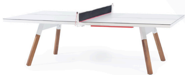
You and Me ping pong table