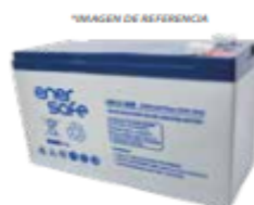
Configuración de baterías 12v9ah x 20 unidades