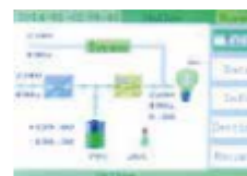
Pantalla color led