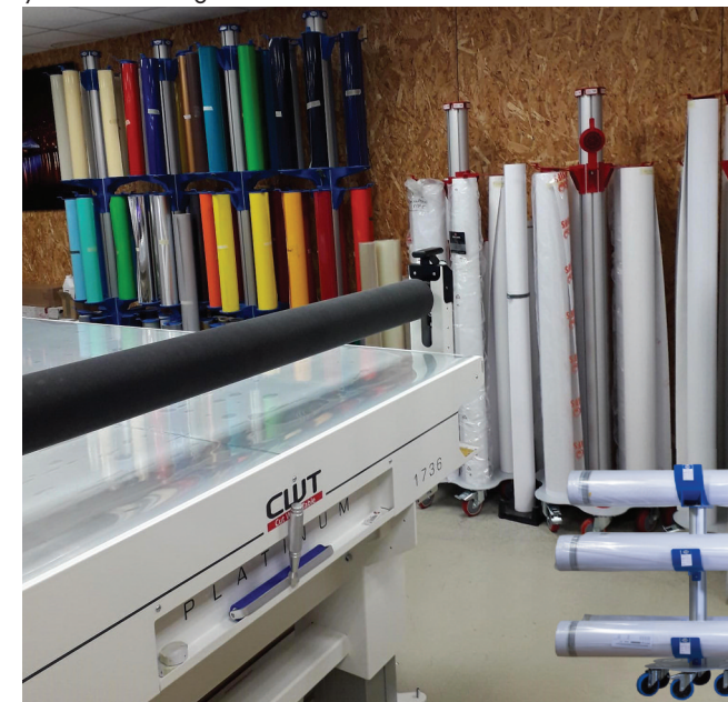
Emprese Com1Pub, Dieppe (76).

A veces es difícil imaginar lo que supone comprar un producto nuevo. Para sortear este obstáculo tan común, la empresa no duda en poner a disposición de los clientes productos en préstamo. "En una feria, si el gerente o el jefe de taller no están juntos, y el primero quiere el consejo del segundo, podemos prestar un producto durante una semana y correr con los gastos de