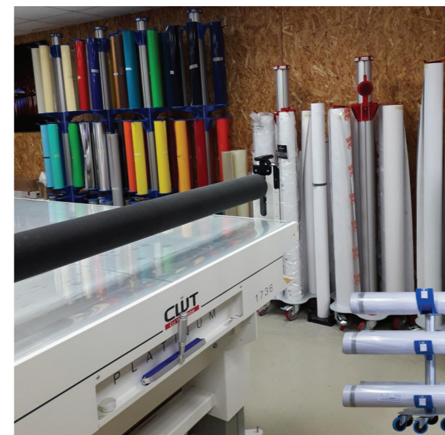
Unternehmen Com1Pub, Dieppe (76).

■ contact@stock-and-roll.fr www.stock-and-roll.fr