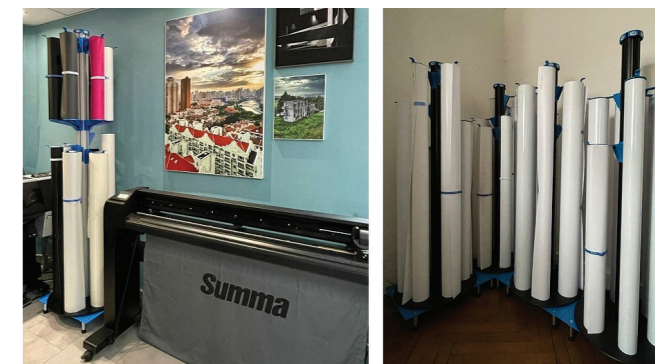
Unternehmen Tirage à Part, Metz (57).

Die Produktpalette des Unternehmens ist im Laufe der Jahre gewachsen, vor allem aufgrund der Nachfrage der Kunden. Die Stock & Roll-Modelle können bis zu 6 160 cm breite Rollen in aufrechter Position lagern und transportieren, während der Grand Stock & Roll für den Transport von bis zu 18 Rollen geeignet ist und bis zu 900 kg transportieren kann. Für größere Breiten, bis zu 5 m,