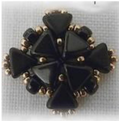
Schéma « Eley »

Matériel : Khéops(K), R11, R15, Matubo (M). Vous êtes prêtes ?