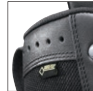
Matériau de grande qualité