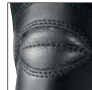
Protection du tendon