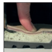
Système de mousse injectée HAIX® MSL