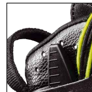
HAIX® Climate System