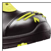
HAIX® High Durability Cap System