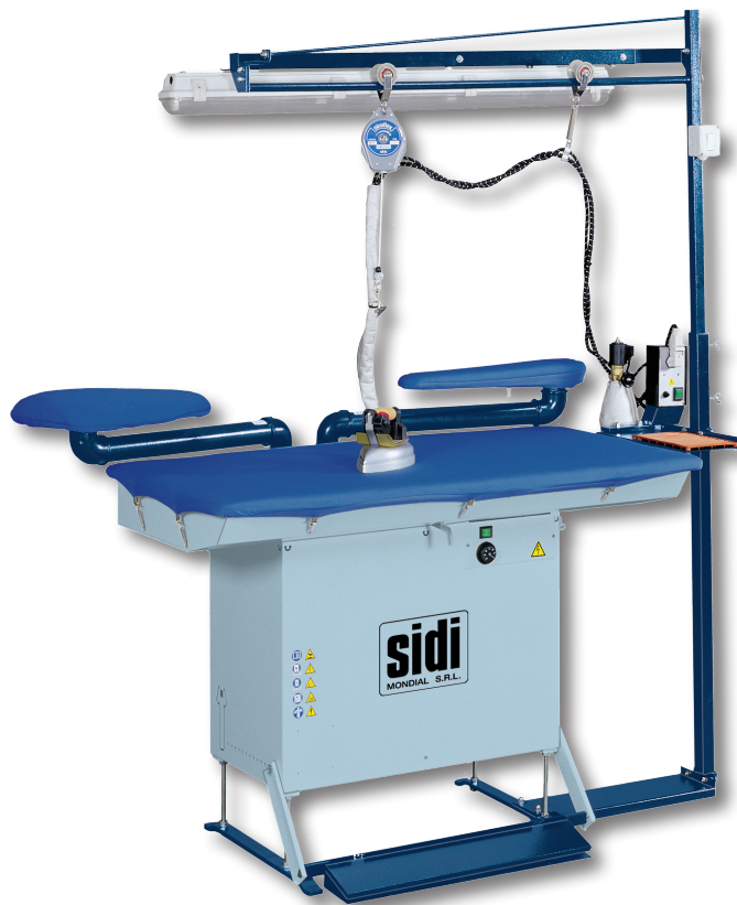
Venus-R + Bracci