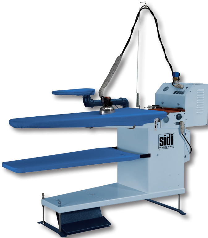
Venus M + caldaia