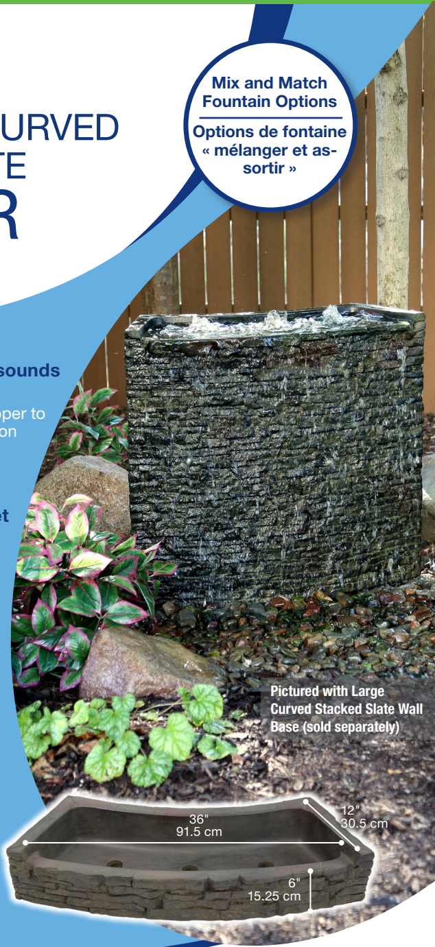
Pictured with Large Curved Stacked Slate Wall Base (sold separately)