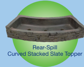
Rear-Spill Curved Stacked Slate Topper