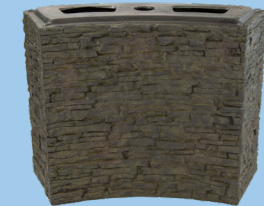
Large Curved Stacked Slate Base