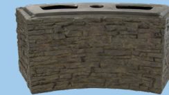
Small Curved Stacked Slate Base