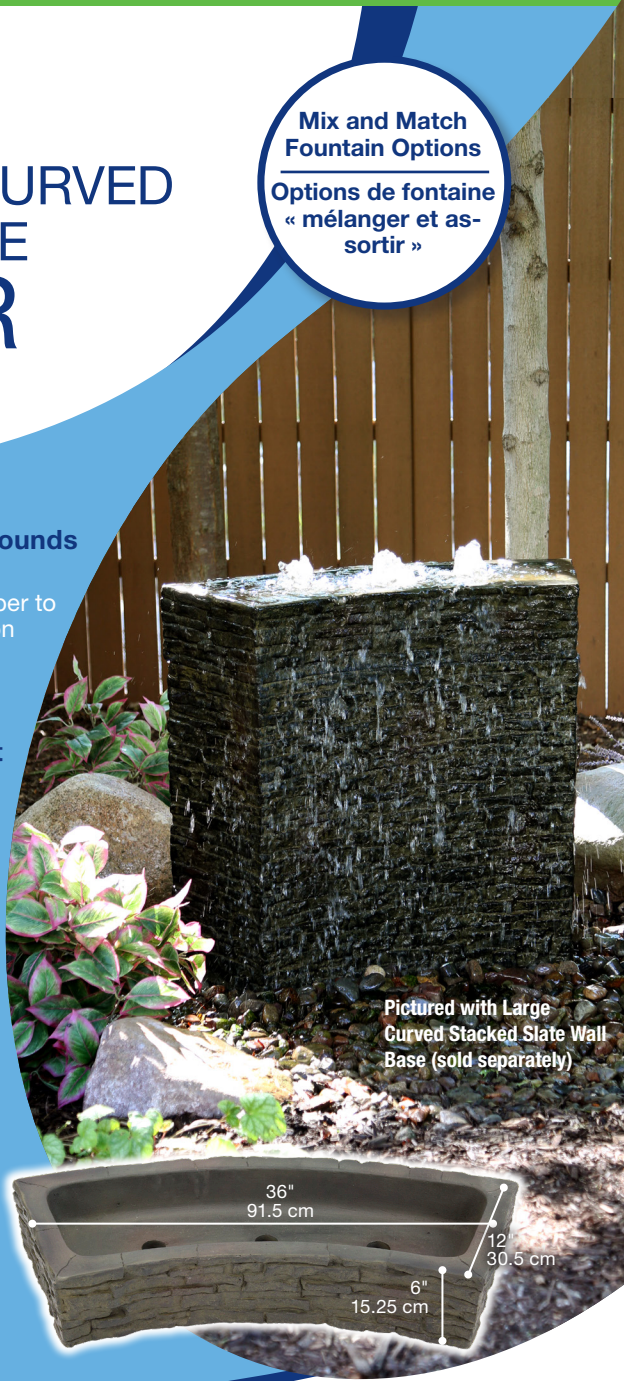
Pictured with Large Curved Stacked Slate Wall Base (sold separately)