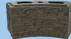
Small Curved Stacked Slate Base