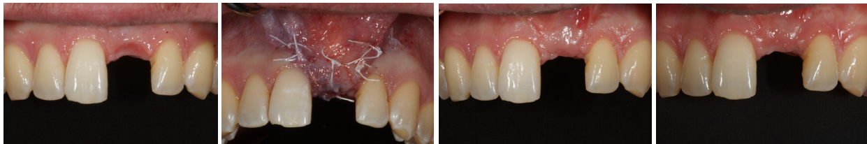
Antes de la cirugía

La cicatrización por intención primaria es un aspecto fundamental de la reconstrucción de tejidos blandos. Este proceso debe llevarse a cabo rápidamente con la menor cantidad de complicaciones para que sea exitoso. Una vez que dos superficies de la herida se hayan aproximado adecuadamente con suturas libres de tensión y se hayan estabilizado con suturas de respaldo, se puede aplicar PeriAcryl® como sello secundario para proteger el tejido blando de la cirugía. Esta capa de adhesivo ayuda a minimizar la infiltración de bacterias, mejora el cierre de la herida y minimiza la migración de suturas. Notará que, de cinco a diez días después de la cirugía, tal vez haya una pequeña cantidad de PeriAcryl® aún adherida a las suturas. En este caso, debe retirarse para permitir que el tejido de granulación madure y que el tejido blando se fortalezca.