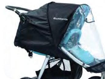
Non-PVC Rain Cover