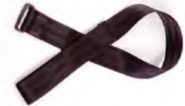
Wrist strap Correa para la muñe corroie de poignet