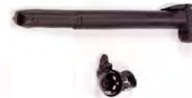
Pump and bell. Bomba y cinturón. Pompe et sonnette.