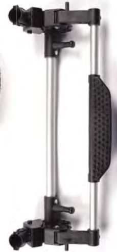
Rear axle Eje trasero Essieu arriere