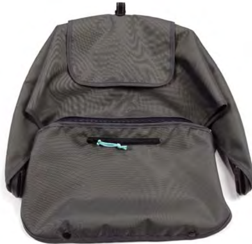
SPF 45+ canopy Capota SPF 45+ Pare-soleil FPS 45+