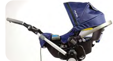
Maxi-Cosi, Nuna & Cybex Car Seat Adapter