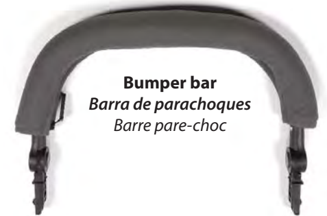
Bumper bar Barra de parachoques Barre pare-choc

Also included but not pictured, Allen wrench, open wrench, operating manual, inflation cheat sheet and warranty registration card.