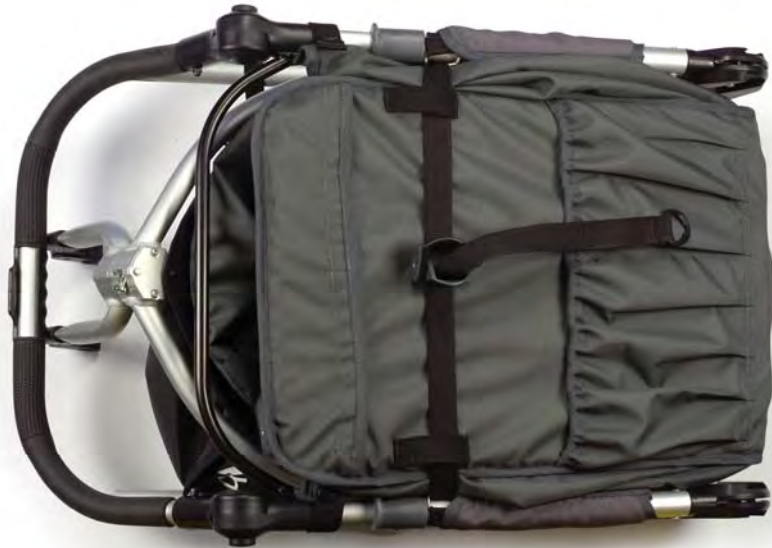
Speed frame Estructura Speed Cadre Speed

Incluido en la caja / Ce que contient la boîte