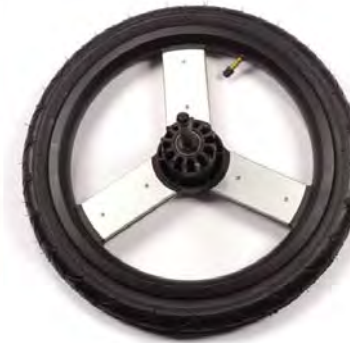
16in rear wheels 40.5cm ruedas trasera Roues de 40.5cm a l'arriere