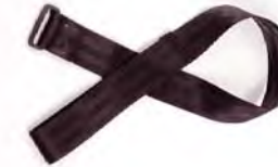
Wrist strap Correa para la muñe corroie de poignet