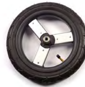
12in front wheel 30.5cm ruedas frontales 30.5cm roues avant