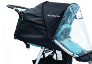
Non-PVC Rain Cover