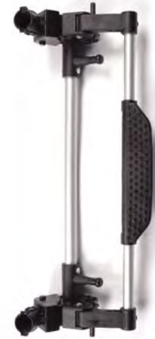
Rear axle Eje trasero Essieu arriere