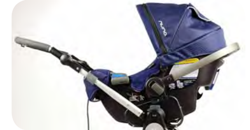
Maxi Cosi & Cybex Car Seat Adapter

For more information visit us at www.bumblaride.com