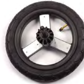
12in rear wheels 30.5cm ruedas traseras Roues de 30.5cm a l'arriere