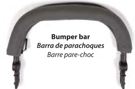
Bumper bar Barra de parachoques Barre pare-choc

Also included but not pictured, Allen wrench, open wrench, operating manual, inflation cheat sheet and warranty registration card.