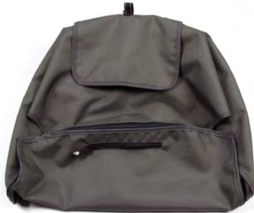
SPF 45+ canopy Capota SPF 45+ Pare-soleil FPS 45+