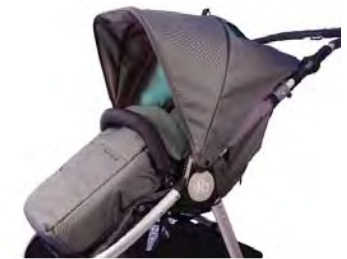
Footmuff & Liner