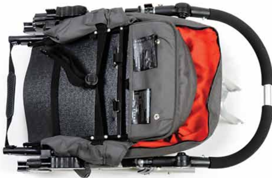
Indie frame Estructura Indie Cadre Indie