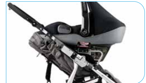
Maxi Cosi & Cybex Car Seat Adapter

For more information visit us at www.bumblerride.com