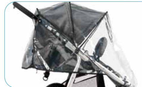
Non-PVC Rain Cover