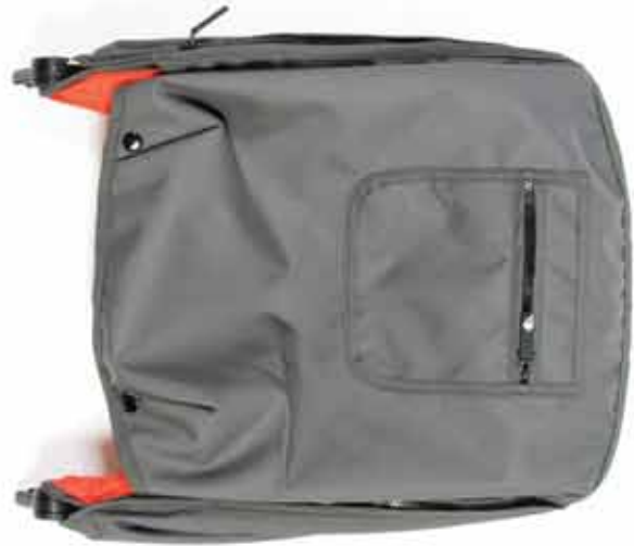
SPF 45 sun canopy Capota SPF 45 Pare-soleil FPS 45

Incluido en la caja / Ce que contient la boîte?