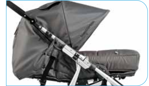
Footmuff & Liner