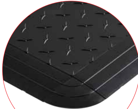
Assemblage des rampes et des angles