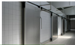
Cámaras de refrigeración.