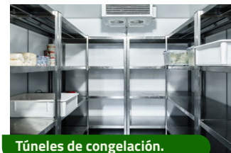
Túneles de congelación.