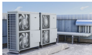
Trabajos en exterior.