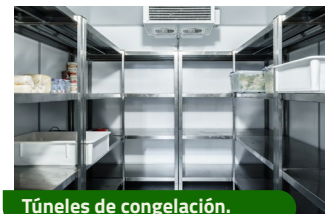
Túneles de congelación.