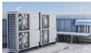
Trabajos en exterior.