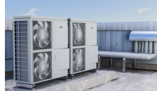
Trabajos en exterior.