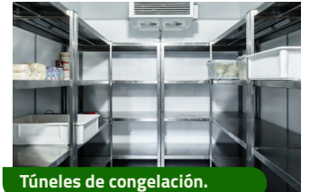
Túneles de congelación.