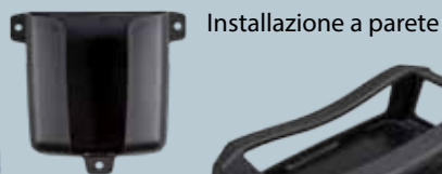
Installazione a parete