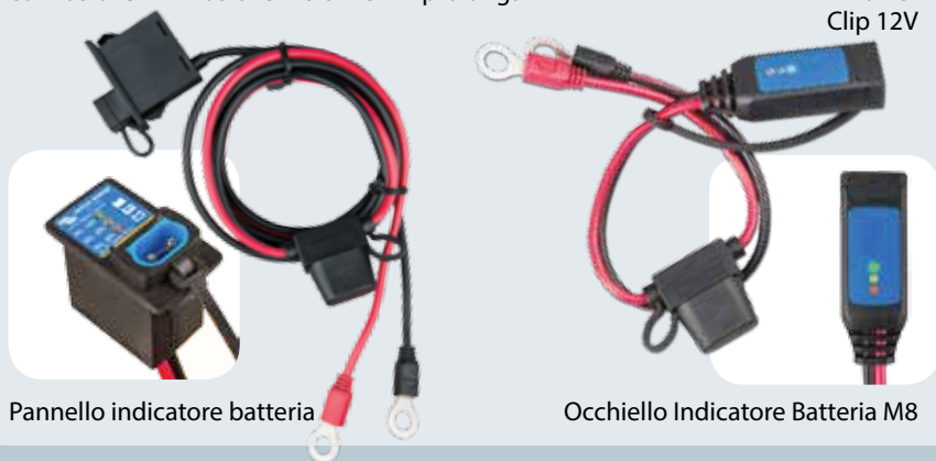
Pannello indicatore batteria