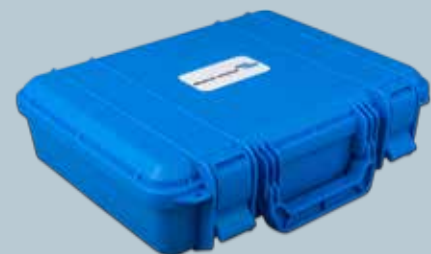
Custodia portatile per Caricatori Blue Smart IP65 ed accessori