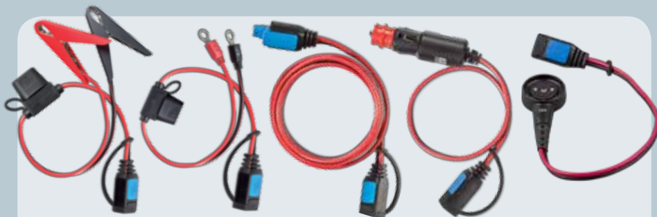
Morsetti con fusibile