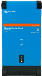
Inverter Phoenix Smart 12/3000