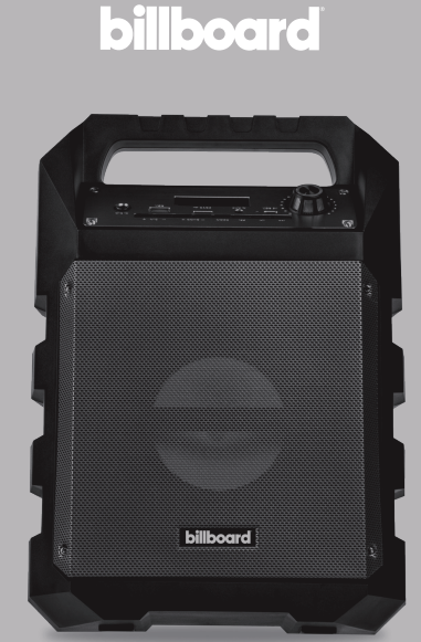
STEEL Bocina 5" BT inalámbrica

AGRADECIMIENTOS Gracias por adquirir la bocina BT inalámbrica STEEL de Billboard® .