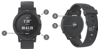
DIAGRAMA DE PRODUCTO