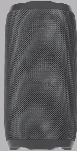
RHYTHM Bocina BT inalámbrica portable