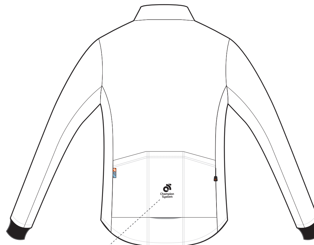
当社のロゴを背面にも1カ所配置してください。 背面