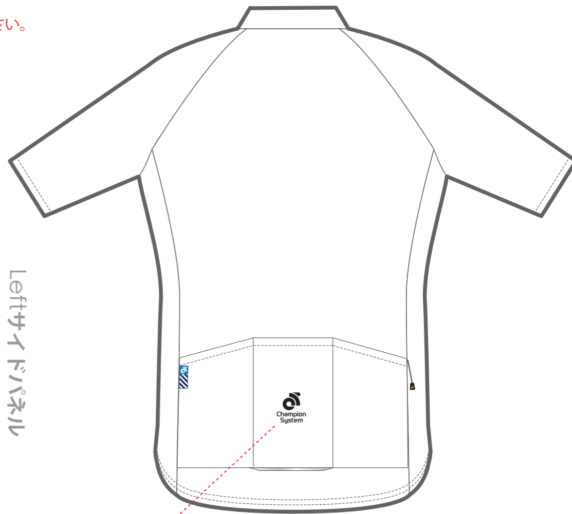
Tech ジャージ - 背面