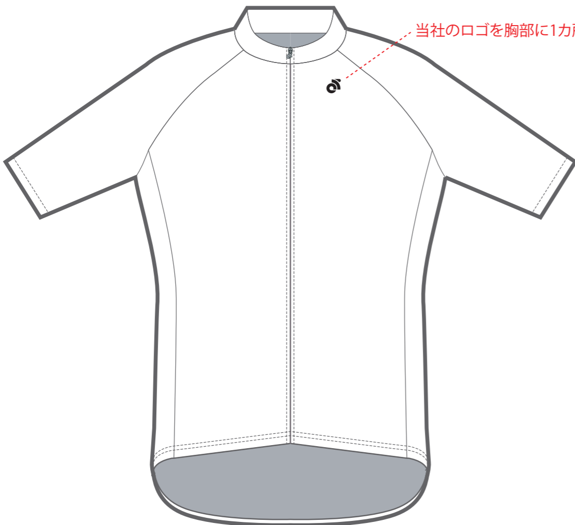
TECH ジャージ - 正面