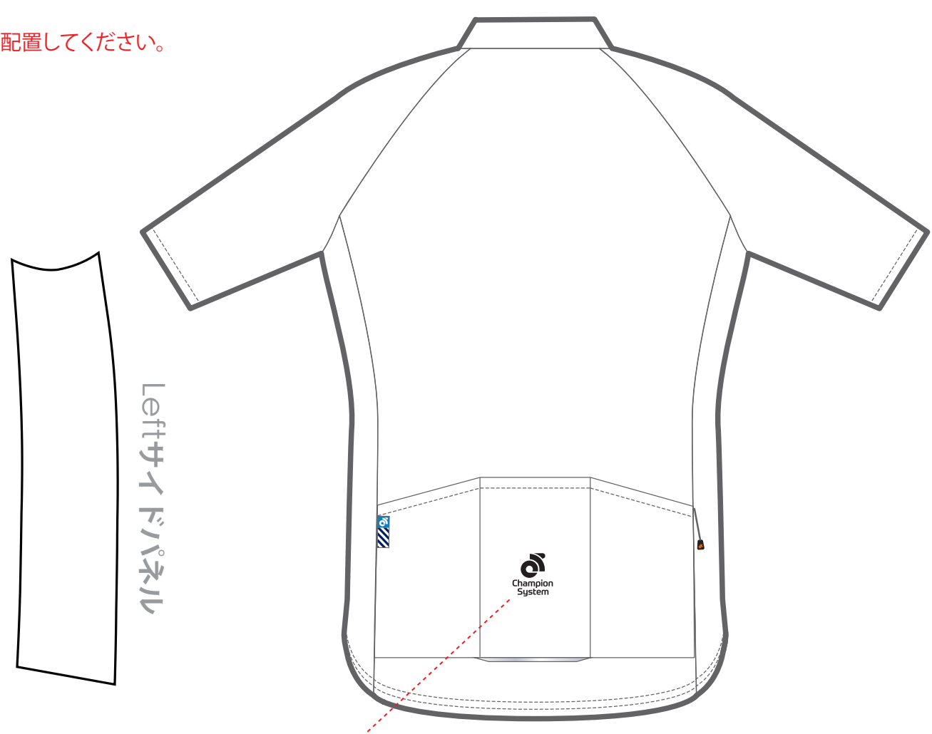
Tech ジャージ - 背面