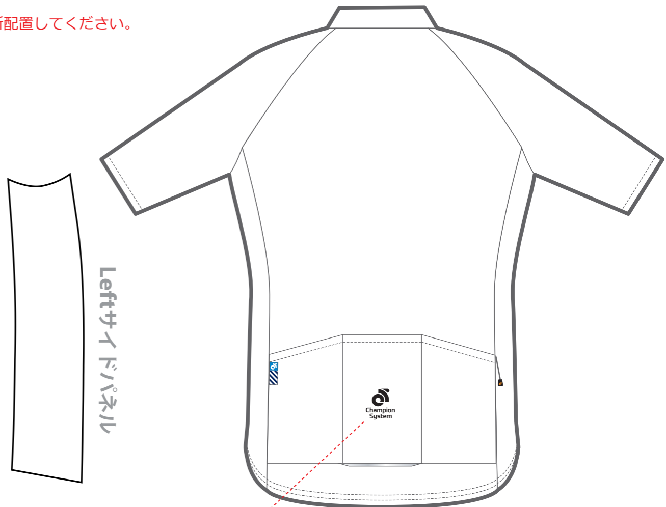
Tech ジャージ - 背面