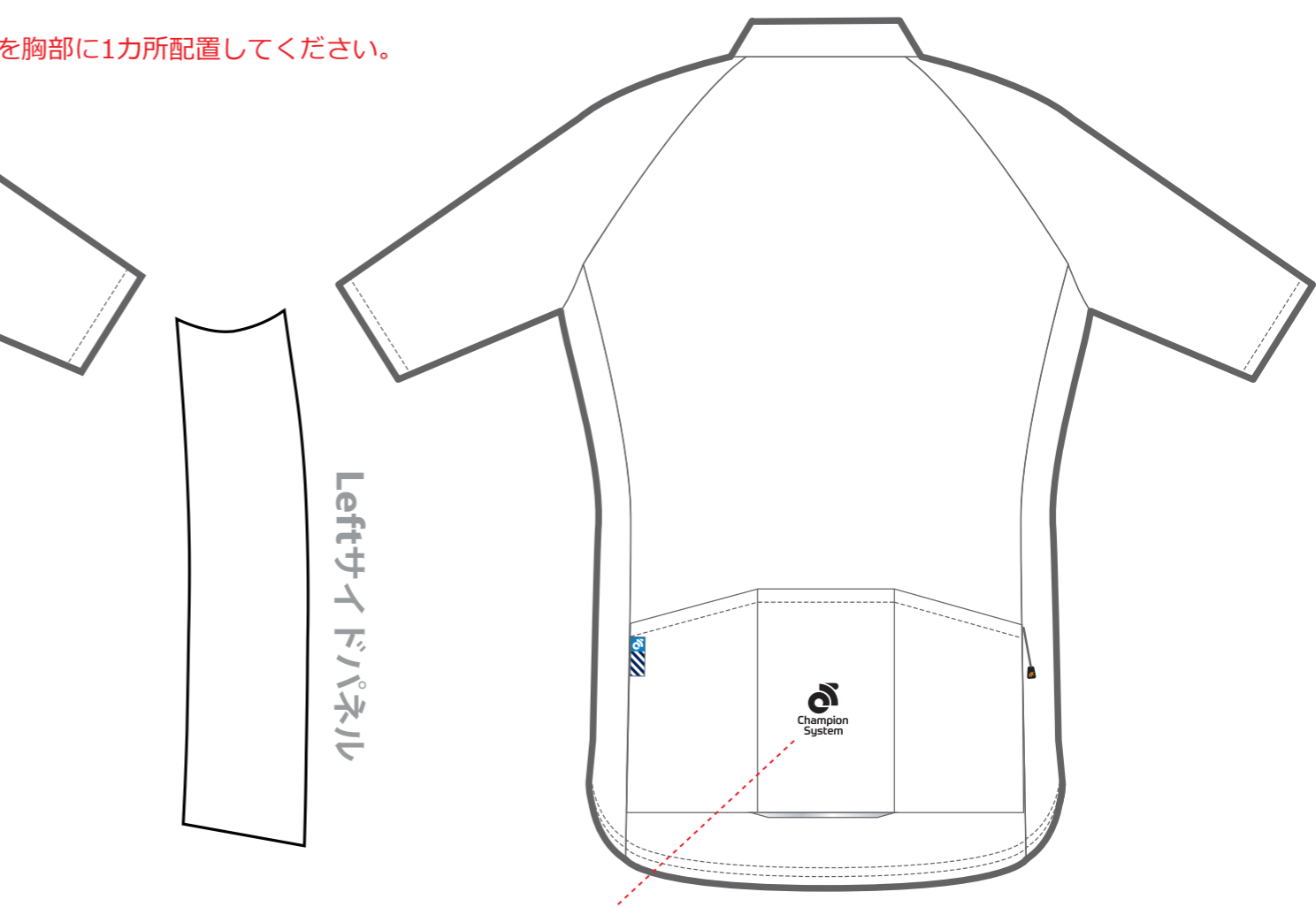
Performance ジャージ - 背面

Graphic Editor: ZZK Start Date: 2020/01/25 End Date: 2020/01/25 Scale 1 : 10