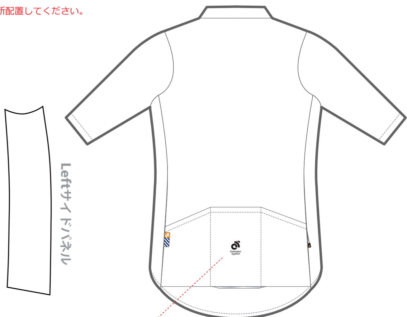
APEX ジャージ - 背面

Graphic Editor: ZZX Start Date: 2020/01/25 End Date: 2020/01/25