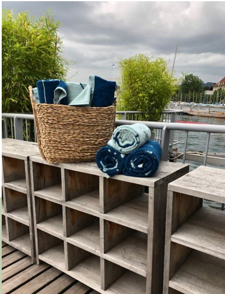
Unsere TreeTowels für das Seebad Enge.