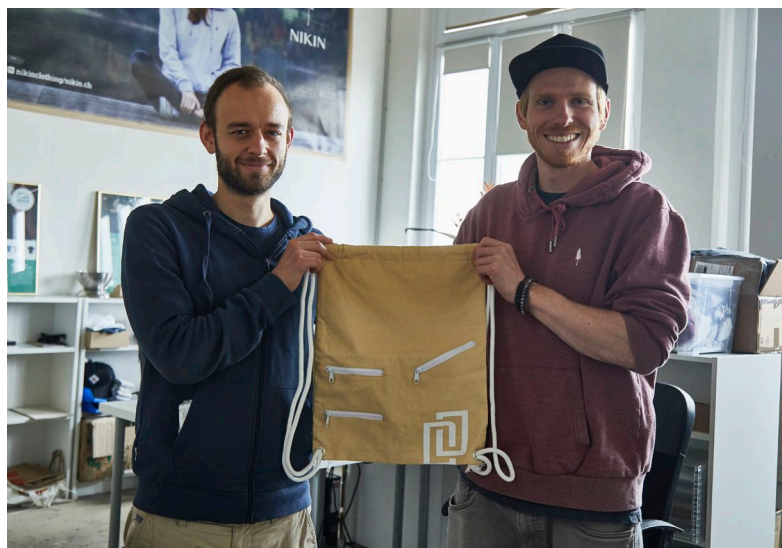
Zu Beginn hiess die Marke noch NIKIT und der Gymbag war das erste Produkt.