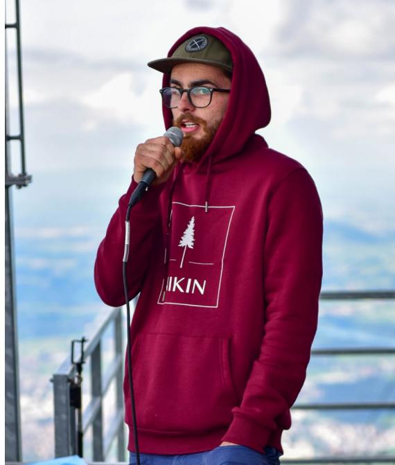
Eventbild von The Highline Extreme 2019.