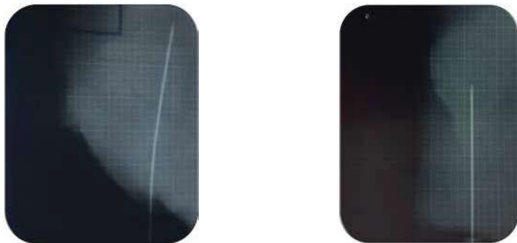
Figura 2: Radiografías demostrando la desviación de la aguja al momento de la punción.