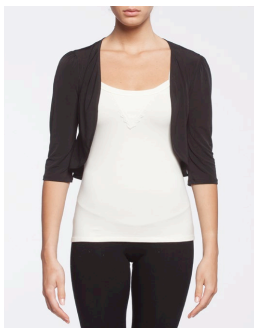
16-110 Nectar Noir / Black