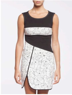
12-321 Ishaki Blanc / White G2