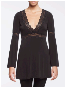
18-173 Joplin Noir / Black G2 / XXS-XXL