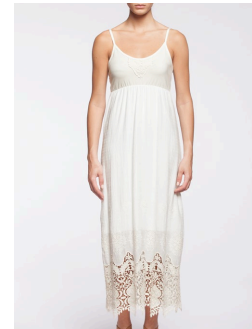
12-312 Elanna Crème / Cream G1