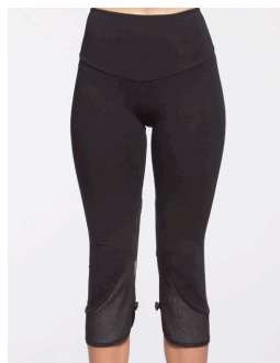
14-101 Santiago Noir / Black