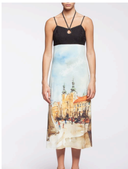
12-328 Ibiza Jaune / Yellow G3