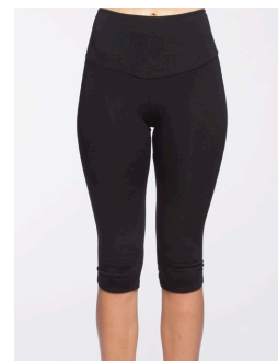
14-137 Sutton Noir / Black