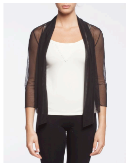
19-163 Anzio Noir / Black