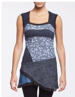
11-101 Twist Bleu / Blue