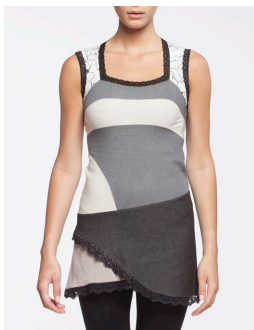
11-101 Twist Blanc / White