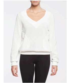
18-171 Nelligan Blanc / White G1