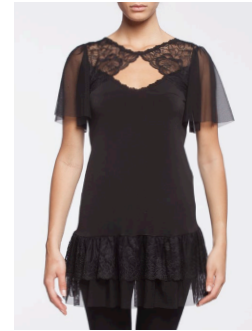
II-214 Nissi Noir / Black G2