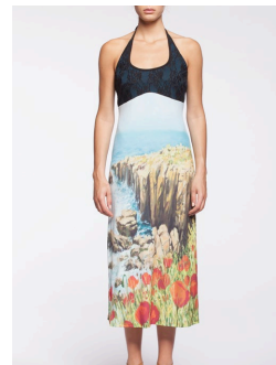
12-331 Oleniz Vert / Green G3