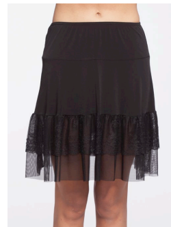
13-196 Diani Noir / Black G2