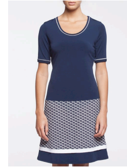
12-325 Oreti Marine / Navy G3