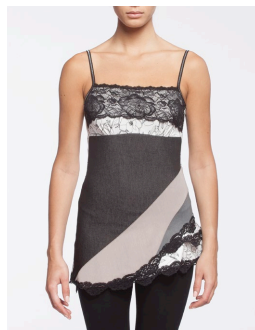
11-102 Cancan Blanc / White