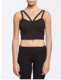
50-106 Rogue Noir / Black G3