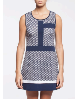
12-324 Logan Marine / Navy G3 / XXS-XXL