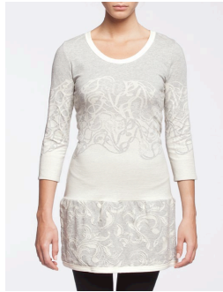
II-211 Margaret Gris / Grey G1