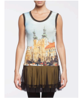
II-215 Habaka Jaune / Yellow G3