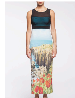
12-332 Mantula Vert / Green G3