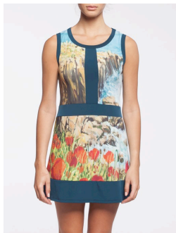
12-329 Quinn Vert / Green G3 / XXS-XXL