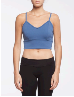
50-105 Mylia Bleu / Blue G1