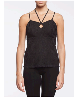
17-163 Nathan Noir / Black G3