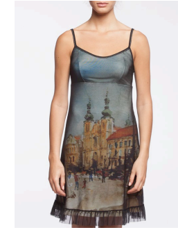
12-326 Madri Jaune / Yellow G3