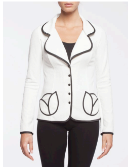
19-182 Paris Blanc / White G1 / XXS-XXL