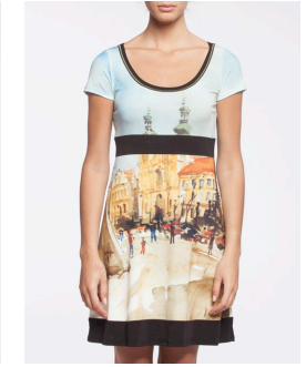
12-327 Norona Jaune / Yellow G3 / XXS-XXL