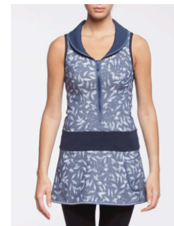
11-122 Marilou Bleu / Blue