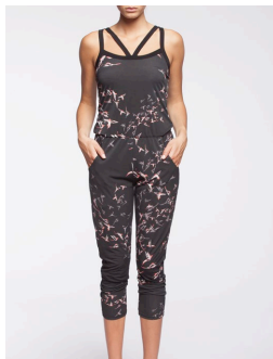
53-103 Ronaldo Noir / Black G2