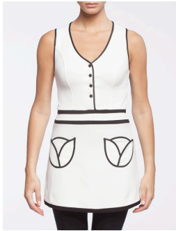
II-209 Ginger Blanc / White G1 / XS-XXL