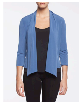
19-163 Anzio Bleu / Blue