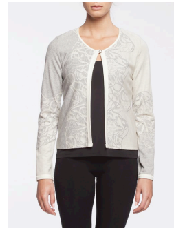
19-184 Lorelai Gris / Grey G1 / XS-XXL