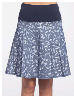
13-134 Lea Bleu / Blue