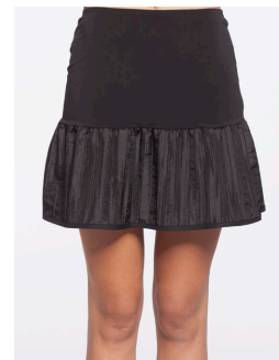
41-101 Clémentine Noir / Black