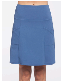
13-195 Rico Bleu / Blue G1