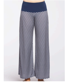
14-177 Marley Marine / Navy G3