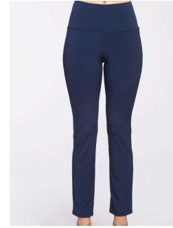
14-176 Emendo Marine / Navy G3