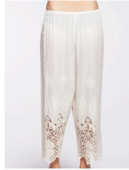
14-174 Bondi Crème / Cream G1