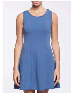
12-310 Fiji Bleu / Blue G1 / XXS-XXL