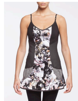
11-111 Illusion Rose / Pink