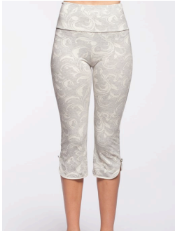
14-172 Palladino Gris / Grey G1