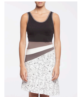
12-320 Velika Blanc / White G2