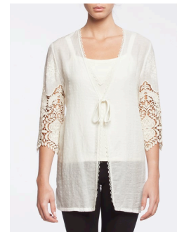
19-185 Tarek Crème / Cream G1