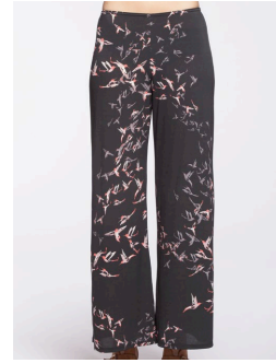
14-175 Finch Noir / Black G2