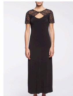
12-318 Veronica Noir / Black G2 / XXS-XXL