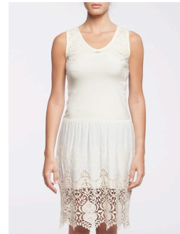
12-311 Amora Crème / Cream G1