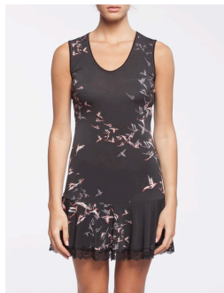
12-316 Ibis Noir / Black G2