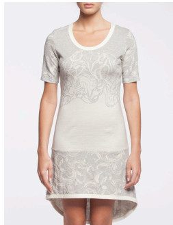
12-309 Ulyss Gris / Grey G1 / XXS-XXL