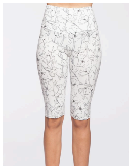
14-179 Fallon Blanc / White