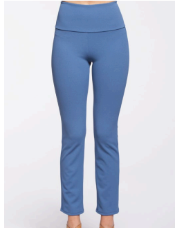
14-173 Tulum Bleu / Blue G1