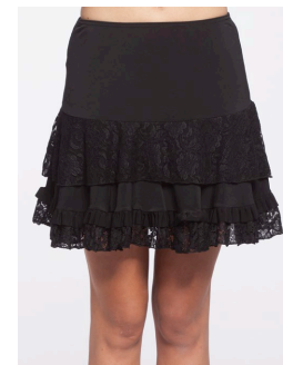
41-102 Contrepoint Noir / Black