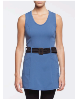
II-212 Meredith Bleu / Blue G1