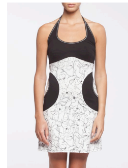
12-319 Lanka Blanc / White G2 / XXS-XL