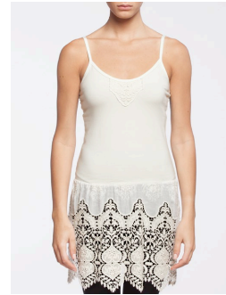
II-213 Bahia Crème / Cream G1