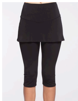
14-120 Sophia Noir / Black