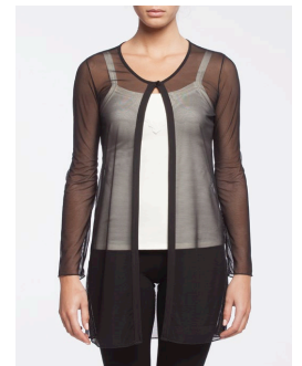
19-186 Mariah Noir / Black G2 / XS-XXL