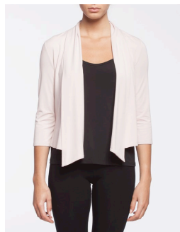
19-163 Anzio Rose / Pink