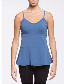
17-160 Elba Bleu / Blue G1