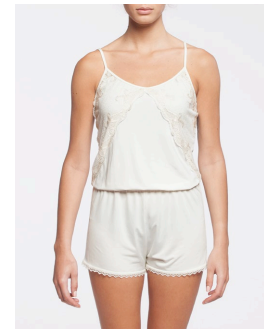
43-106 Kaelin Crème / Cream G1