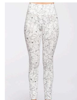
14-178 Nala Blanc / White XS-XXL