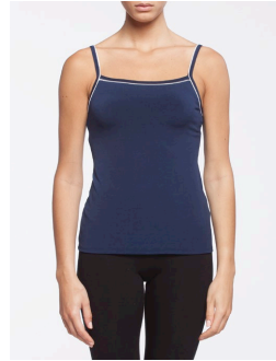
17-161 Barbados Marine / Navy G3