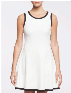
12-308 Betty Blanc / White G1 / XXS-XXL