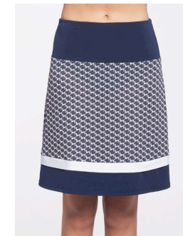
13-198 Nadola Marine / Navy G3