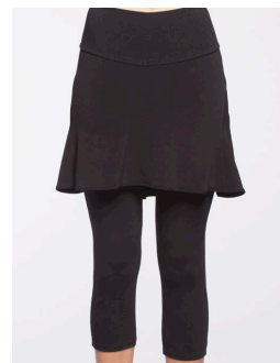
14-127 Palma Noir / Black