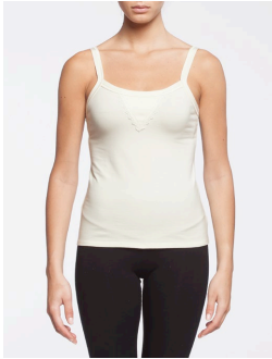
17-159 Akela Crème / Cream G1