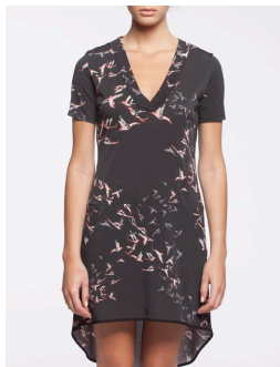
12-314 Sid Noir / Black G2 / XXS-XXL