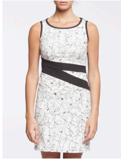
12-322 Rory Blanc / White G2