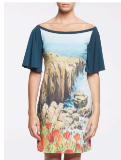
12-330 Balos Vert / Green G3