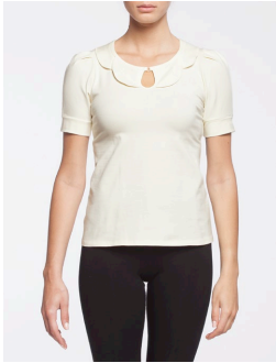
15-149 Haley Crème / Cream G1