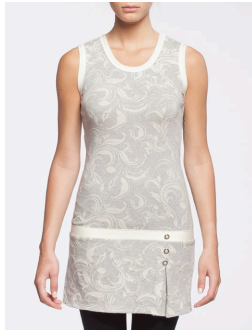
II-210 Cybil Gris / Grey G1