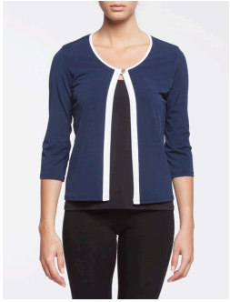
19-187 Gilmore Marine / Navy G3 / XS-XXL