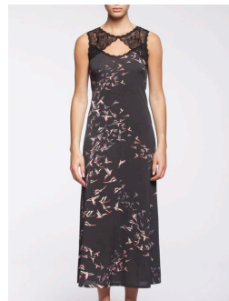
12-317 Sirius Noir / Black G2 / XXS-XXL