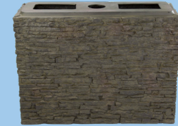
Large Straight Stacked Slate Base