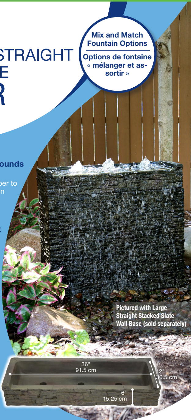
Pictured with Large Straight Stacked Slate Wall Base (sold separately)