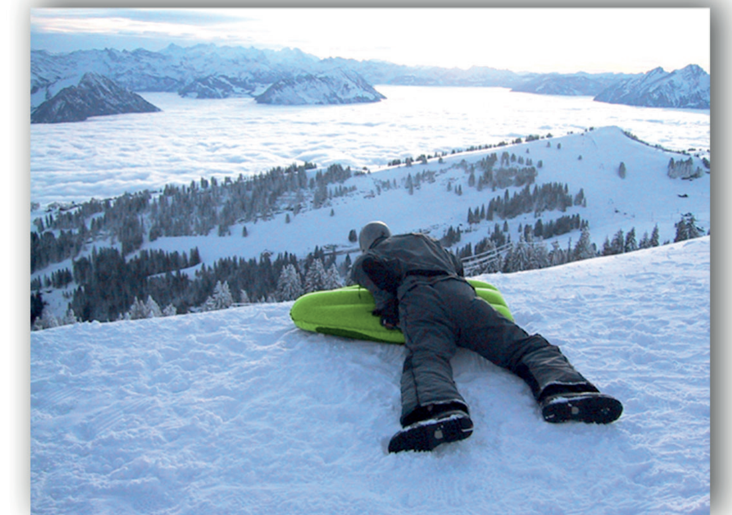
Bremsen: mit Füßen, Board quer stellen