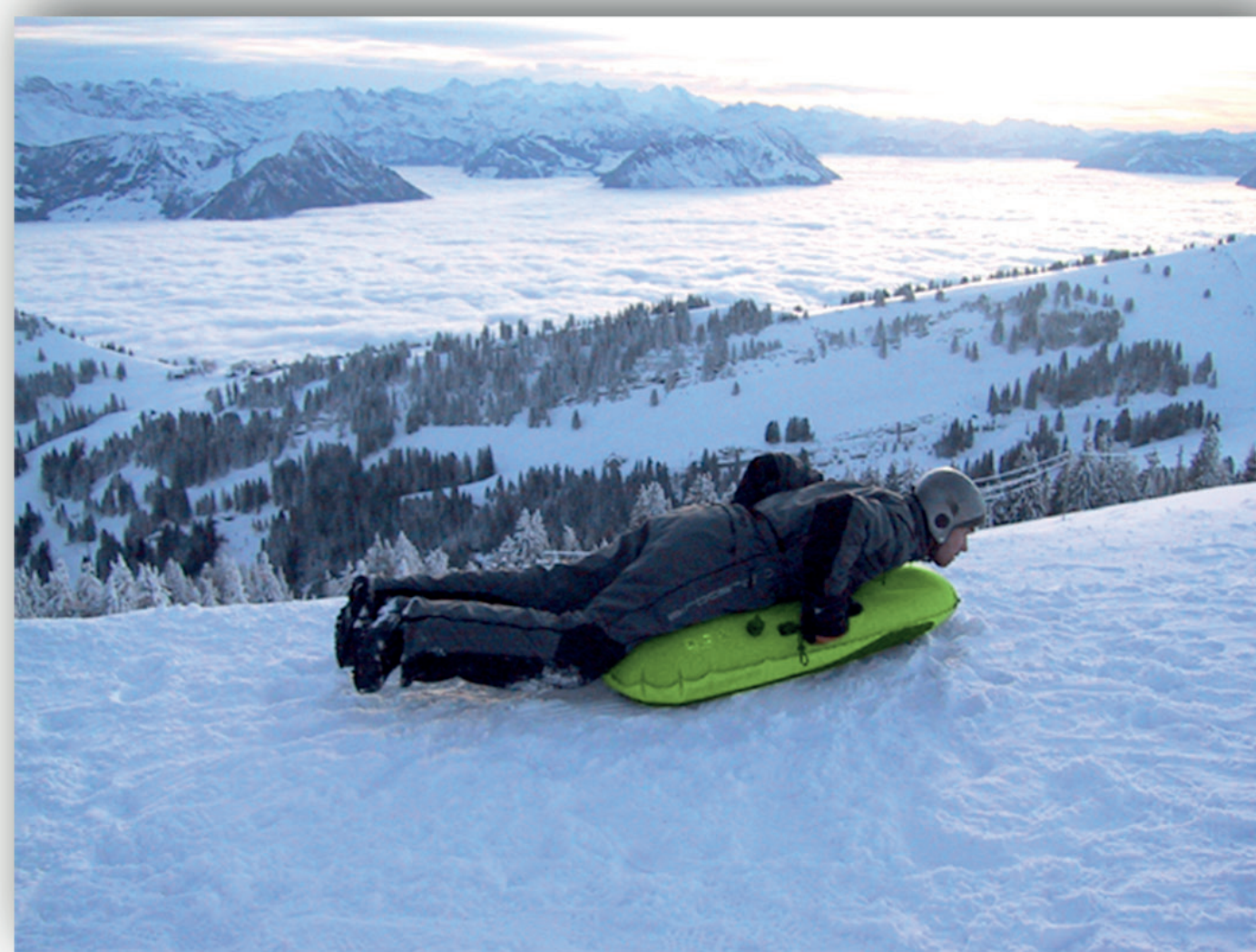
Optimale Position finden