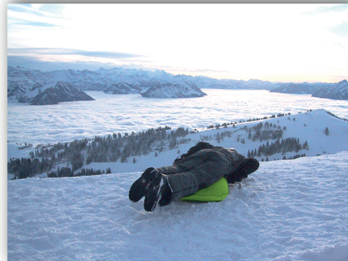
Gewichtsverlagerung für Rechtskurve