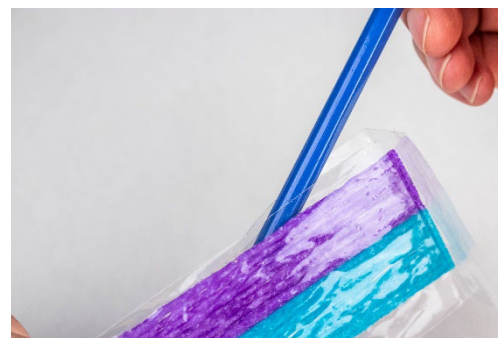
3. Slide pencil down package