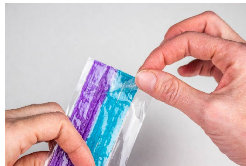
1. Open Top Flap