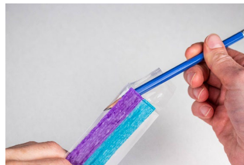
2. Use a pencil to tear side