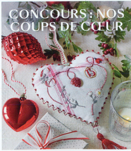
CONCOURS: NOS COUPS DE CŒUR