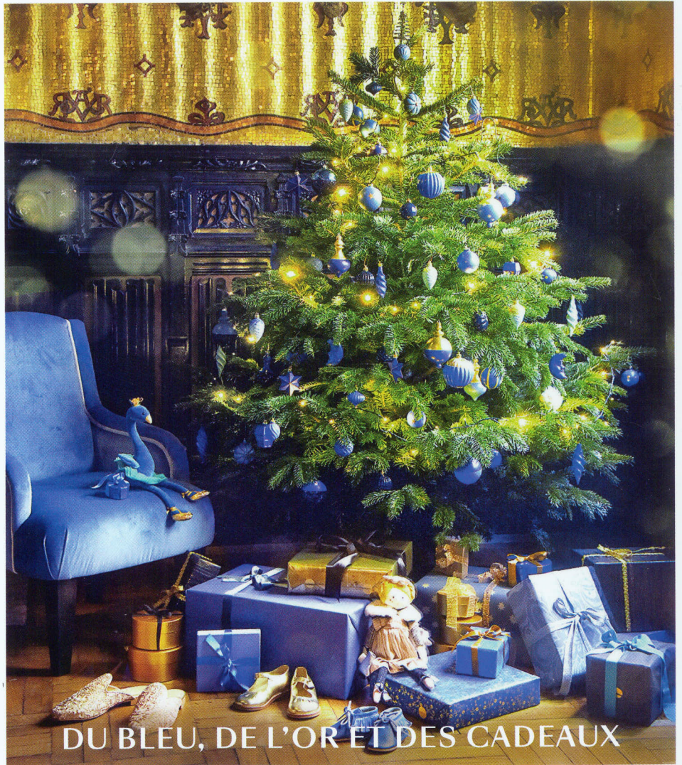
DU BLEU, DE L'OR ET DES CADEAUX