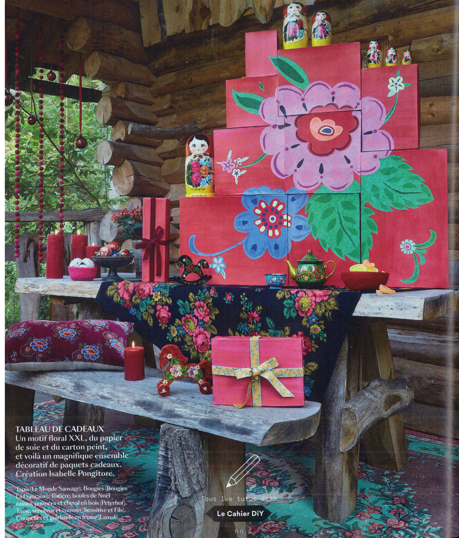
TABLEAU DE CADEAUX

CE NOËL, MA CABANE A L'ÂME SLAVE. DANS UNE AMBIANCE HAUTE EN COULEURS, LES MOTIFS FOLKLORIQUES NOUS INVITENT AU VOYAGE.