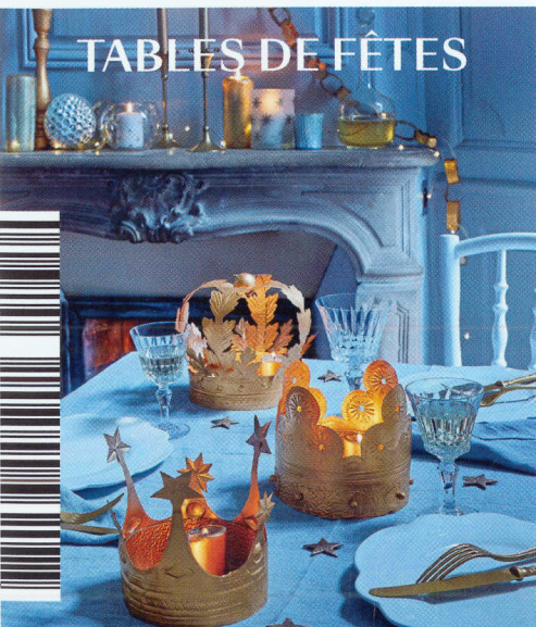
TABLES DE FÊTES