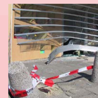
voorkom aanzienlijke schade met SecuPost anti-ramzuilen