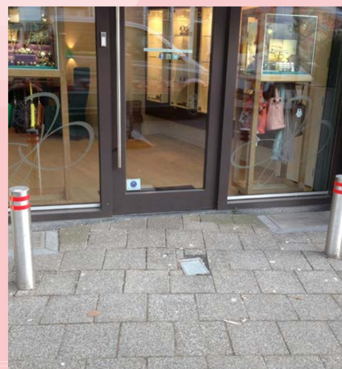
combinatie van statische en verwijderbare SecuPost anti-ramzuilen