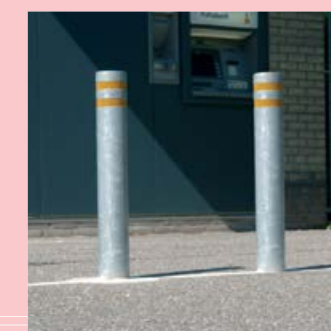
voorkomt ramkraak geld-automaat