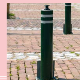
in veel kleuren leverbaar