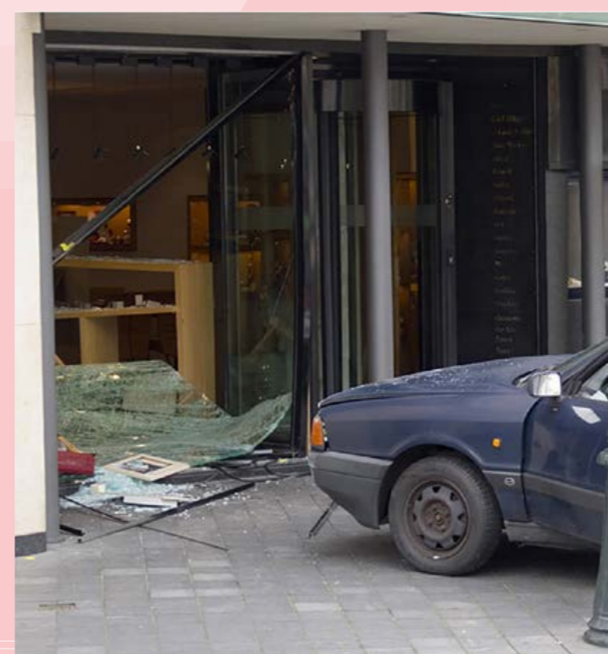
Geen anti-ramzuilen toegepast