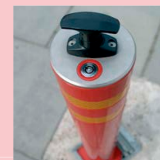
in vrijwel elke kleur leverbaar