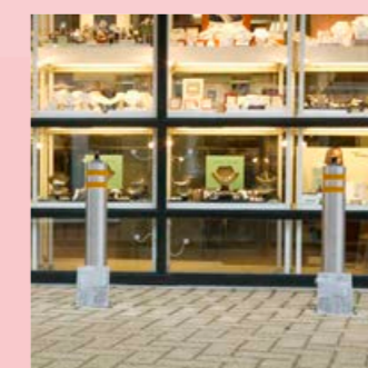
beveiligt tegen ramkraken