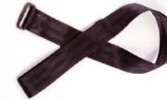
Wrist strap Correa para la muñe corroie de poignet