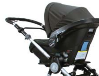
Car Seat Adapters