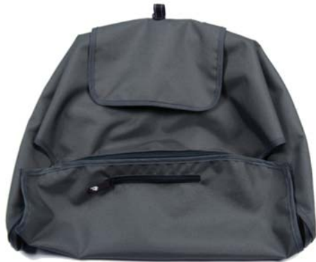
UPF 45+ canopy Capota UPF 45+ Pare-soleil UPS 45+