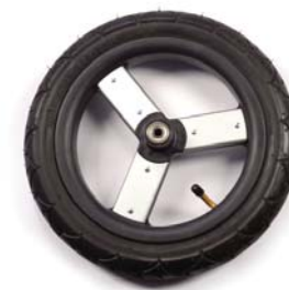
12in front wheel 30.5cm ruedas frontales 30.5cm roues avant