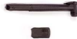
Pump and hinge cover (for use with car seat) Bomba, cubierta con bisagras (para su uso con el adaptador de asiento de coche) y la campana Pompe, couvercle (pour utilisation avec le siége d'auto pour bébé) et sonnette