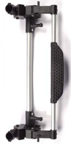
Rear axle Eje trasero Essieu arriere