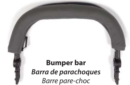
Bumper bar Barra de parachoques Barre pare-choc

Also included but not pictured, 2 Allen wrenches, open wrench, operating manual, inflation cheat sheet and warranty registration card.