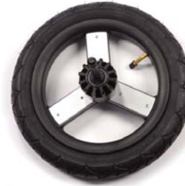
12in rear wheels 30.5cm ruedas traseras Roues de 30.5cm a l'arriere