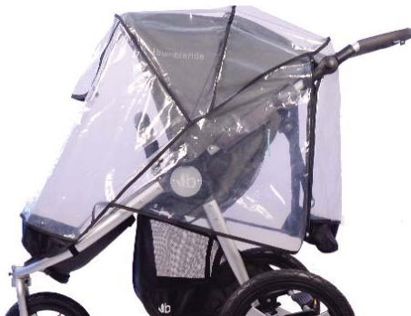
Non-PVC Rain Cover