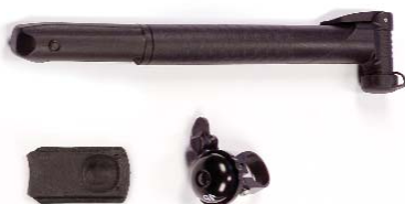
Pump, hinge cover (for use with car seat) and bell. Bomba, cubierta con bisagras (para usar con un adaptador de asiento para automóviles) y cinturón. Pompe, couvre charnière (à utiliser avec l'adaptateur pour siège) et sonnette.