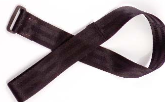
Wrist strap Correa para la muñe corroie de poignet