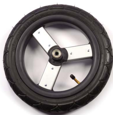
12in front wheel 30.5cm ruedas frontales 30.5cm roues avant