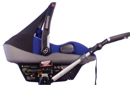
Maxi Cosi & Cybex Car Seat Adapter