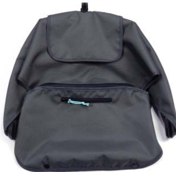
UPF 45+ canopy Capota UPF 45+ Pare-soleil UPS 45+