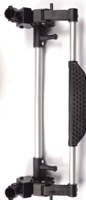
Rear axle Eje trasero Essieu arriere