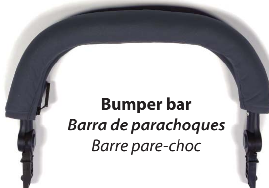
Bumper bar Barra de parachoques Barre pare-choc

Also included but not pictured, 2 Allen wrenches, open wrench, operating manual, inflation cheat sheet and warranty registration card.