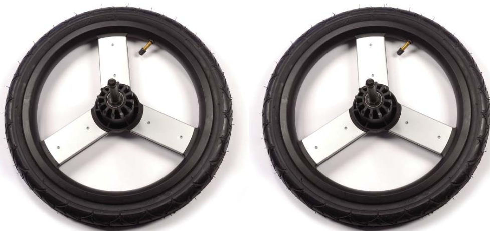
16in rear wheels 40.5cm ruedas trasera Roues de 40.5cm a l'arriere