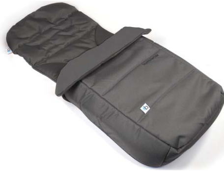
Footmuff & Liner