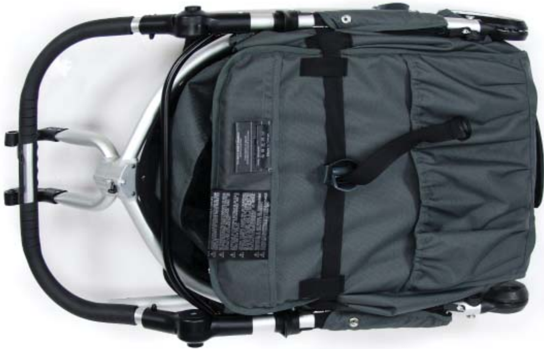
Speed frame Estructura Speed Cadre Speed

Incluido en la caja / Ce que contient la boîte?