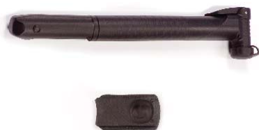
Pump and hinge cover (for use with car seat) Bomba, cubierta con bisagras (para su uso con el adaptador de asiento de coche) y la campana Pompe, couvercle (pour utilisation avec le siège d'auto pour bébé) et sonnette