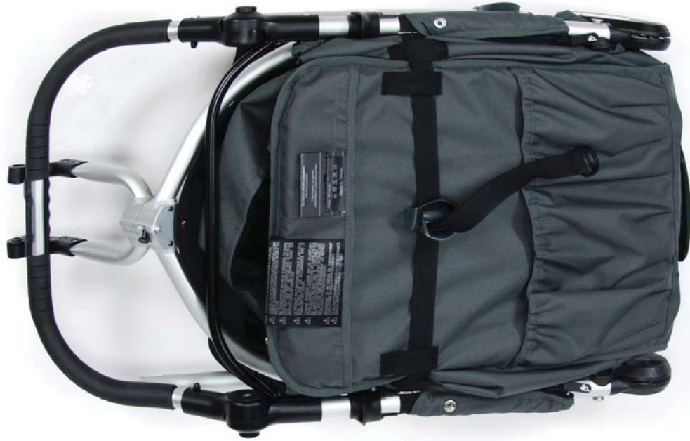
Indie frame Estructura Indie Cadre Indie

Incluido en la caja / Ce que contient la boîte?