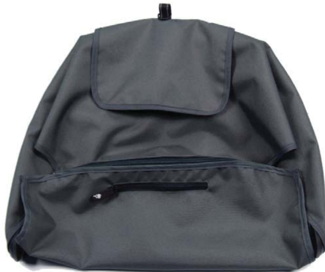
UPF 45+ canopy Capota UPF 45+ Pare-soleil UPS 45+