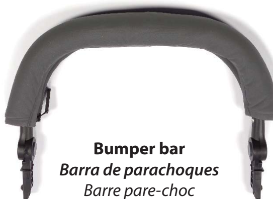
Bumper bar Barra de parachoques Barre pare-choc

Also included but not pictured, 2 Allen wrenches, open wrench, operating manual, inflation cheat sheet and warranty registration card.