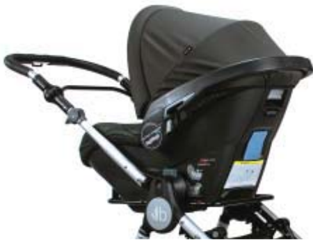
Car Seat Adapters