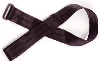
Wrist strap Correa para la muñe corroie de poignet