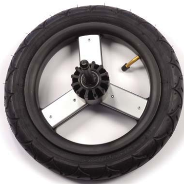
12in rear wheels 30.5cm ruedas traseras Roues de 30.5cm a l'arriere