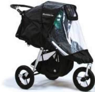
Non-PVC Rain Cover

For more information visit us at www.bumblerride.com