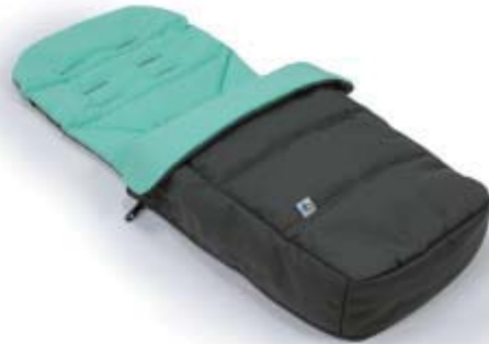
Footmuff & Liner