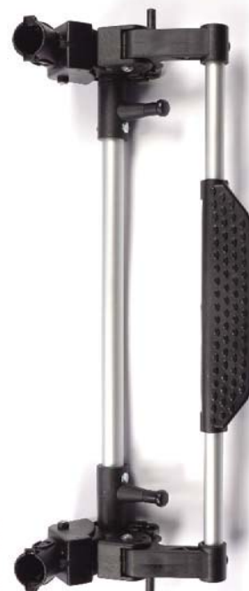
Rear axle Eje trasero Essieu arriere