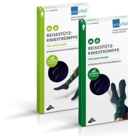
DOKOLENICE SA KOMPRESIJOM

Način funkcionisanja čarapa sa kompresijom je jednostavan i efikasan. Od skočnog zgloba nagore opada mehanički pritisak izazvan spolja i prirodno dovodi do sužavanja vena (smanjenja prečnika vena). Venski zalisci (ventili) mogu bolje da rade, zatvaraju - kao rezultat se dobija bolji krvotok. Prilikom kretanja čarape sa kompresijom pružaju dodatni otpor mišićima, koji zbog toga rade još efikasnije.