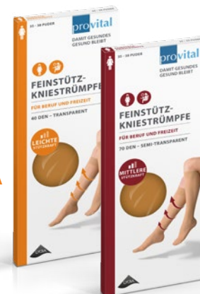
FINE DOKOLENICE SA KOMPRESIJOM