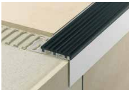
Schlüter®-TREP-B com Schlüter®-TREP-TAP